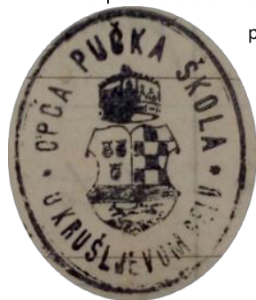
Sl. br. 3. Prvi pečat škole, 1903.