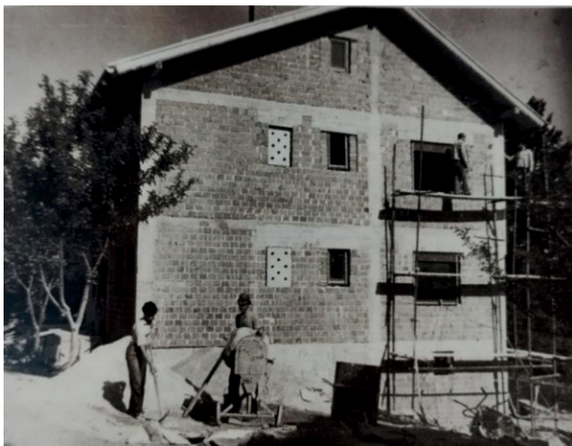
Sl. br. 8. Zgrada s učiteljskim stanovima u Krušljevom Selu, arhiv škole